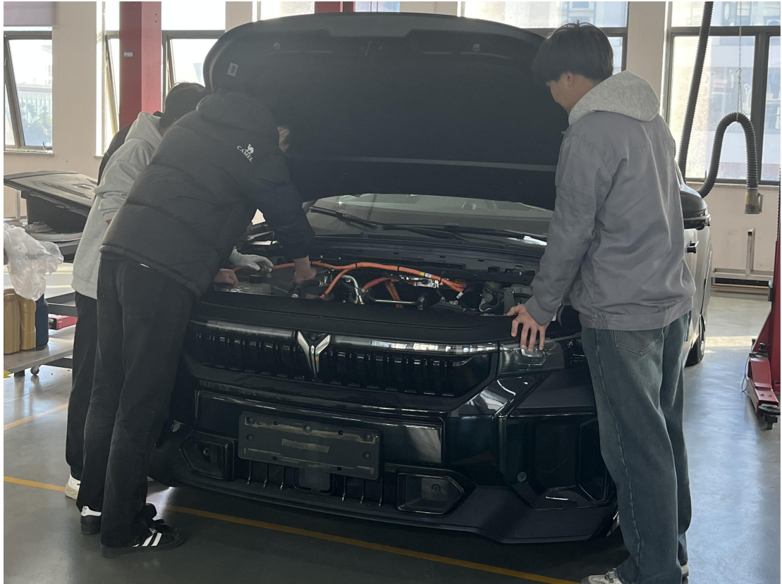
捐赠的岚图 FREE 教学用车