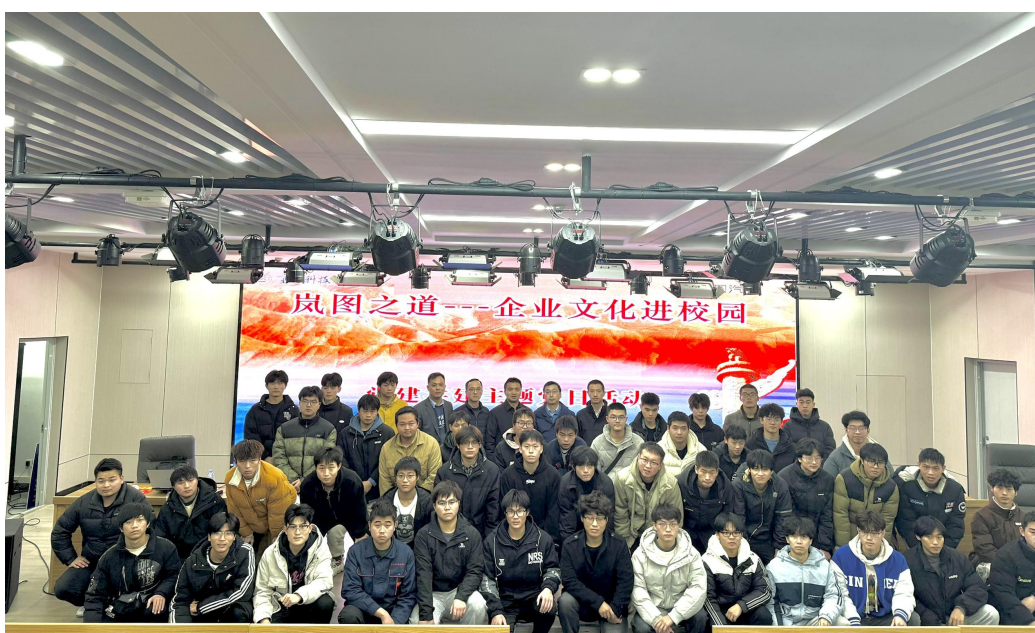
岚图汽车工厂党支部与我校开展党建共建活动