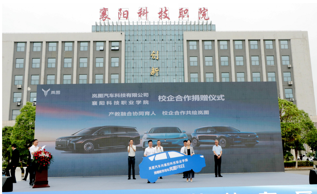
校企合作捐赠仪式

为落实场景化教学，岚图汽车向襄阳科技职业学院捐赠了一台价值 42 万元的教学用车。这一举措让学生在校学习期间就能直接接触到先进的新能源汽车产品，深入了解岚图汽车的生产技术要求。通过实际操作和学习，学生能够更好地掌握新能源汽车的构造、性能、维修保养等知识和技能，为毕业后顺利进入企业工作打下坚实基础。这种资源投入不仅体现了岚图汽车对教育事业的支持，也为校企合作的深入开展提供了有力保障。