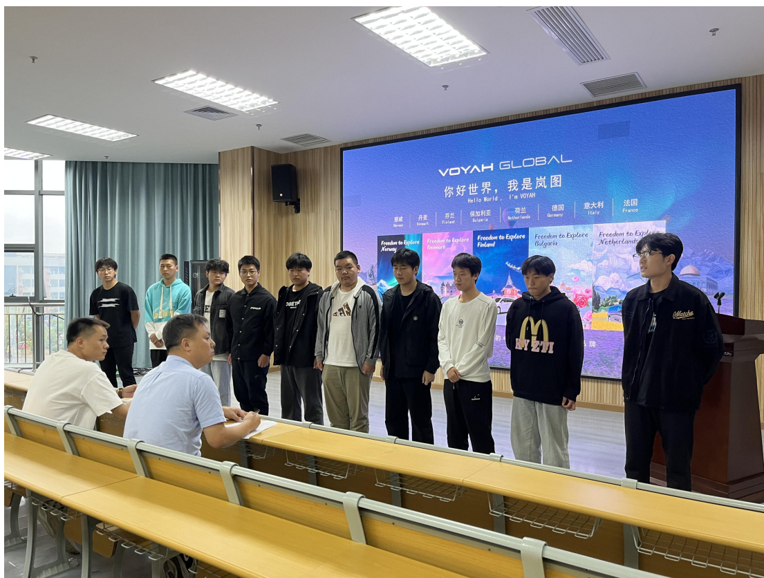
组建岚图汽车订单班